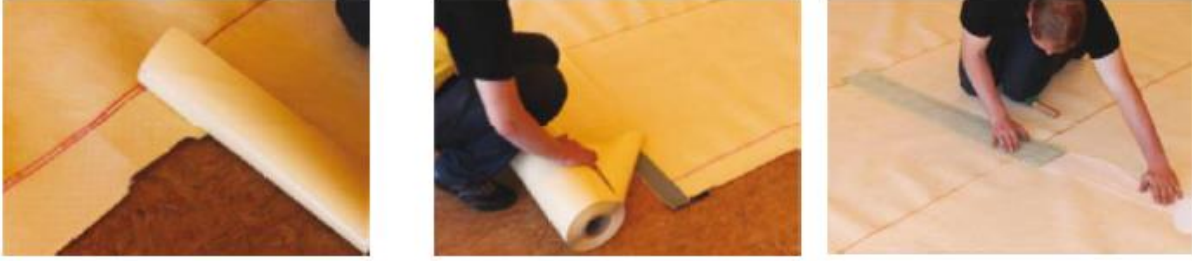
Şekil 3: SikaProof A, membran bitiş detayları