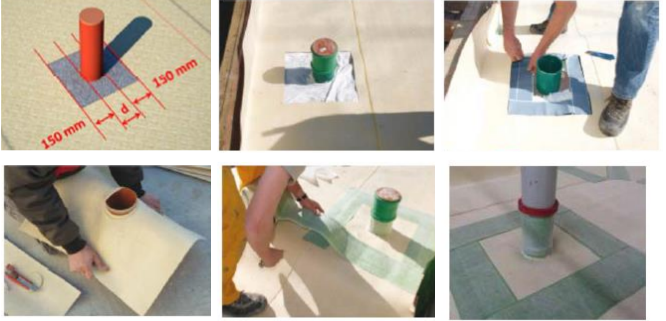
Şekil 4: SikaProof A membran, boru geçiş detayları