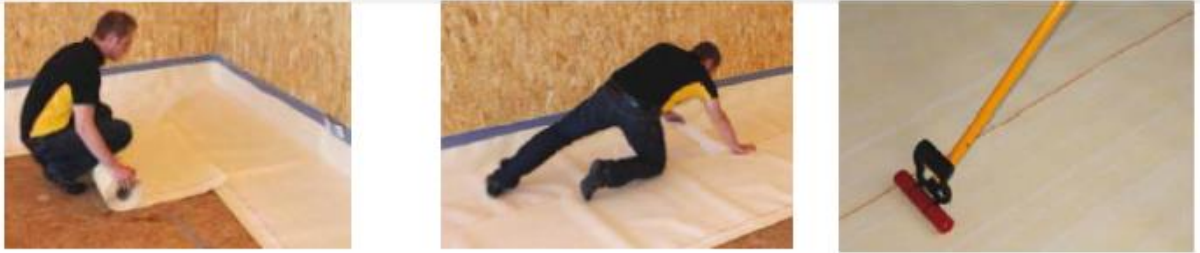
Şekil 2: SikaProof membran temel uygulama detayları